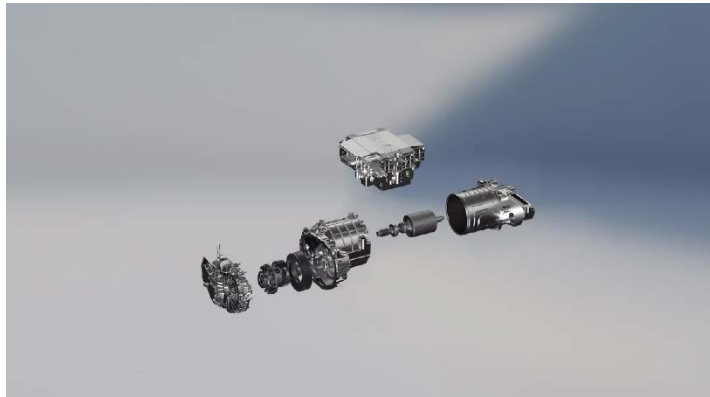
Совершенно новое поколение электрического привода Mach E