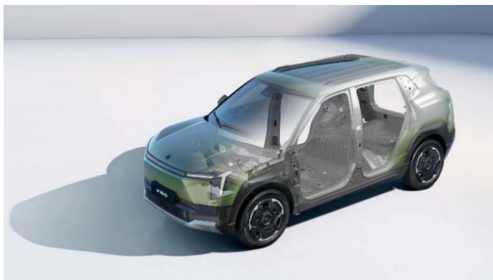
Корпус кузова из высокопрочной стали, 100% кузова оцинковано