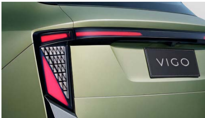
Трёхсекционные задние LED фонари