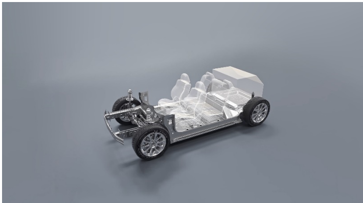
Более 100 улучшенных параметров шасси