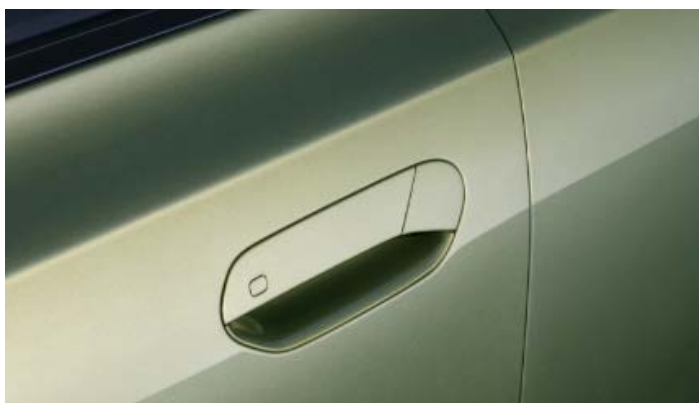
Полускрытая электрическая дверная ручка