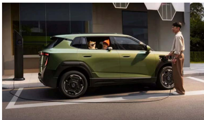
Быстрая зарядка стандарта 3С за 18 минут (от 30 до 80%)

Информация, представленная на данном листе, не является публичной офертой. Содержимое спецификации составлено на основе информации о состоянии конфигурации автомобиля на момент составления данного документа. Чтобы лучше удовлетворять потребности клиентов, производитель продолжает разрабатывать и совершенствовать автомобили. Некоторые конфигурации и характеристики моделей, продаваемых на рынке, могут отличаться от этой конфигурации. Для получения более подробной информации обращайтесь к авторизованным дилерам Dongfeng в Беларуси.