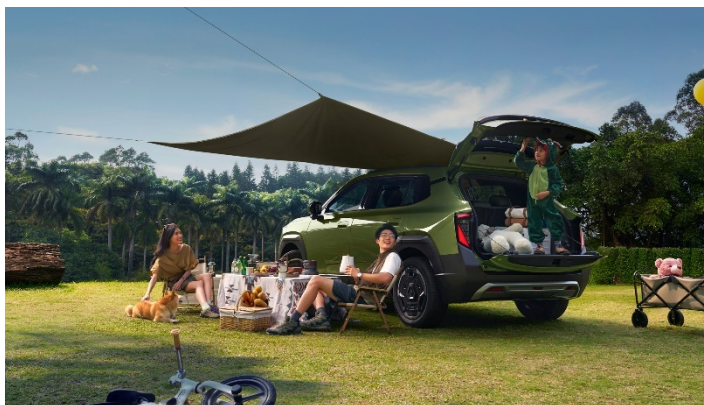
Двухсекционное открытие багажного отделения