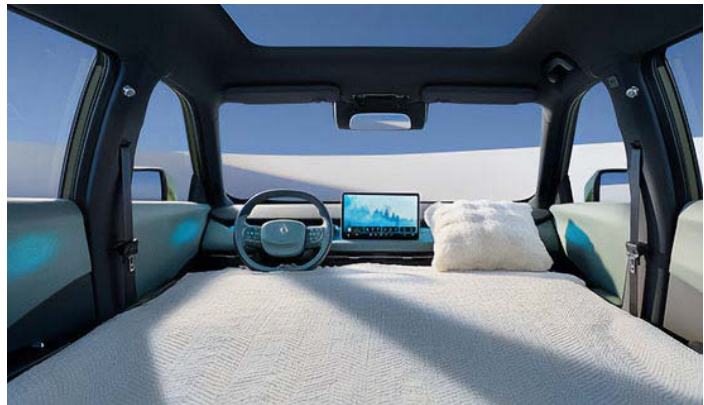
Трансформация сидений салона в зону релакса