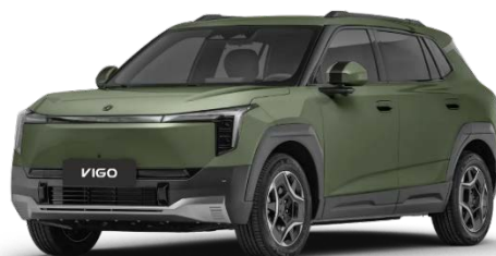
Тёмно-зелёный (+ 1 000 BYN)