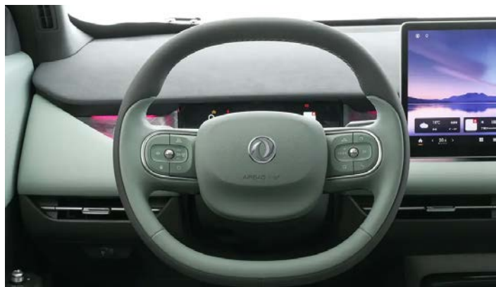
Кожаное рулевое колесо с выбором режима вождения