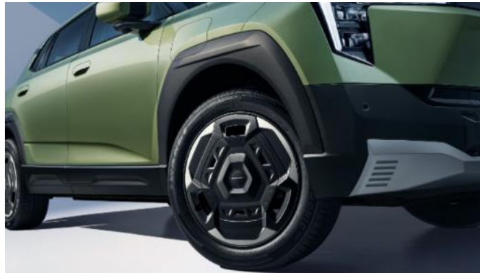
Диски 215/55 R18 с аэродинамическими накладками