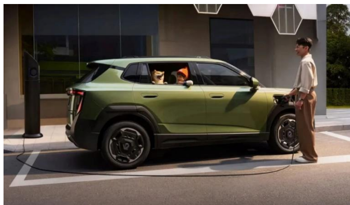
Быстрая зарядка стандарта ЗС за 18 минут (от 30 до 80%)

Информация, представленная на данном листе, не является публичной офертой. Содержимое спецификации составлено на основе информации о состоянии конфигурации автомобиля на момент составления данного документа. Чтобы лучше удовлетворять потребности клиентов, производитель продолжает разрабатывать и совершенствовать автомобили. Некоторые конфигурации и характеристики моделей, продаваемых на рынке, могут отличаться от этой конфигурации. Для получения более подробной информации обращайтесь к авторизованным дилерам Dongfeng в Беларуси.