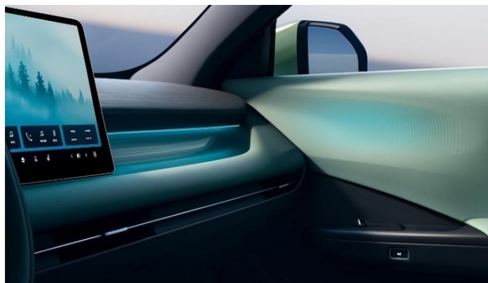
Атмосферная подсветка салона с возможностью выбора цвета