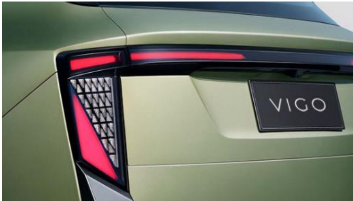
Трёхсекционные задние LED фонари