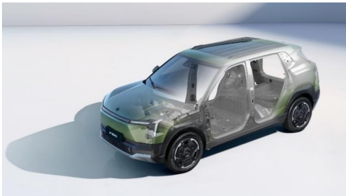
Корпус кузова из высокопрочной стали, 71,9% кузова оцинковано