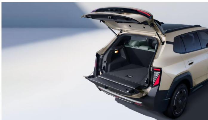
Двухсекционное открытие багажного отделения