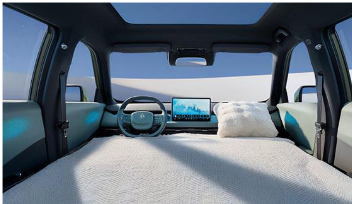
Трансформация сидений салона в зону релакса