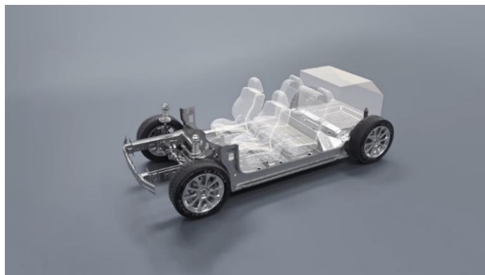
Более 100 улучшенных параметров шасси