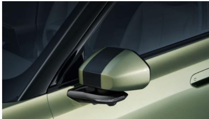
Геометрические зеркала заднего вида с функцией автоскладывания

Информация, представленная на данном листе, не является публичной офертой. Содержимое спецификации составлено на основе информации о состоянии конфигурации автомобиля на момент составления данного документа. Чтобы лучше удовлетворять потребности клиентов, производитель продолжает разрабатывать и совершенствовать автомобили. Некоторые конфигурации и характеристики моделей, продаваемых на рынке, могут отличаться от этой конфигурации. Для получения более подробной информации обращайтесь к авторизованным дилерам Dongfeng в Беларуси.