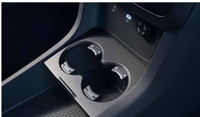
Скрытые подстаканники на центральной консоли