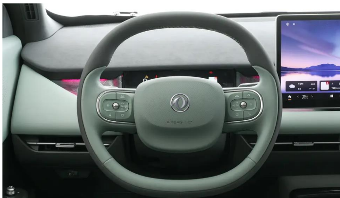
Кожаное рулевое колесо с выбором режима вождения