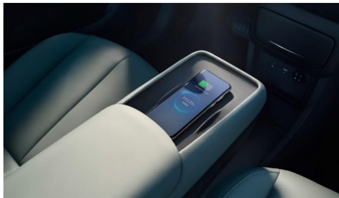
Беспроводная зарядка для смартфона с дополнительной вентиляцией