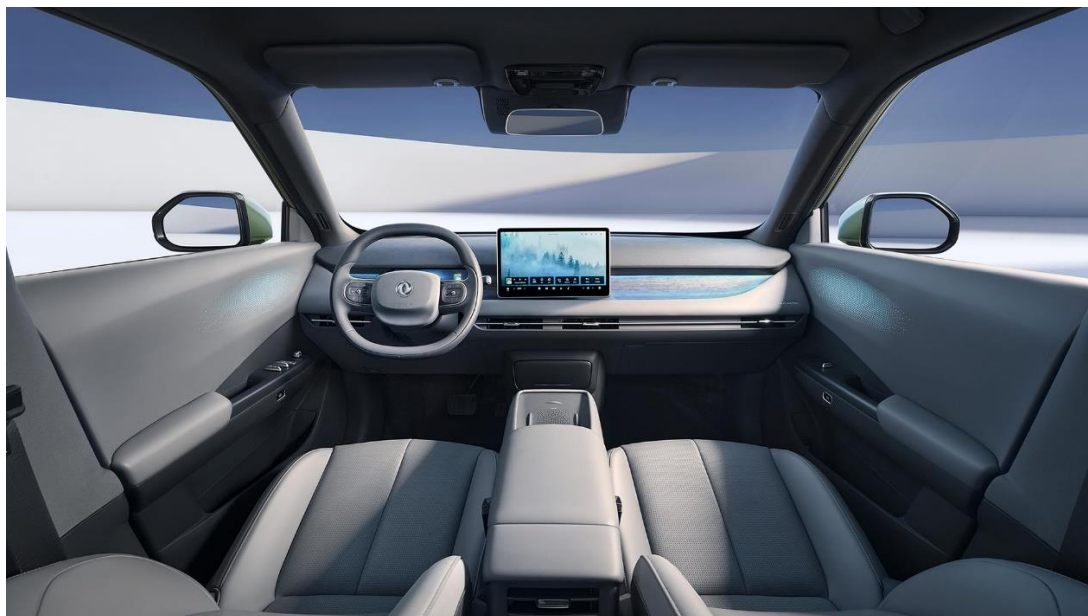
тёмно-серый / чёрные элементы

Информация, представленная на данном листе, не является публичной офертой. Содержимое спецификации составлено на основе информации о состоянии конфигурации автомобиля на момент составления данного документа. Чтобы лучше удовлетворять потребности клиентов, производитель продолжает разрабатывать и совершенствовать автомобили. Некоторые конфигурации и характеристики моделей, продаваемых на рынке, могут отличаться от этой конфигурации. Для получения более подробной информации обращайтесь к авторизованным дилерам Dongfeng в Беларуси.