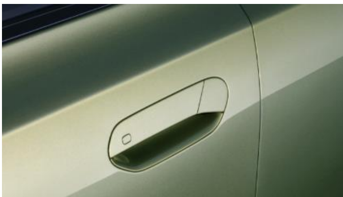
Полускрытая электрическая дверная ручка