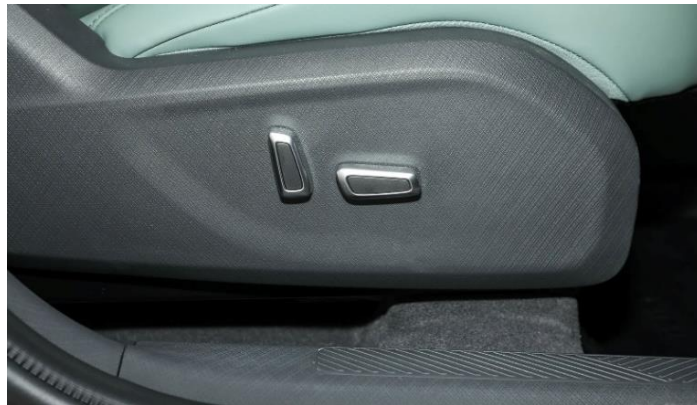
Электрорегулировка передних сидений в 6-ти направлениях