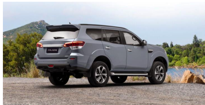
32° угол въезда / 27° угол съезда / 243 мм дорожный просвет