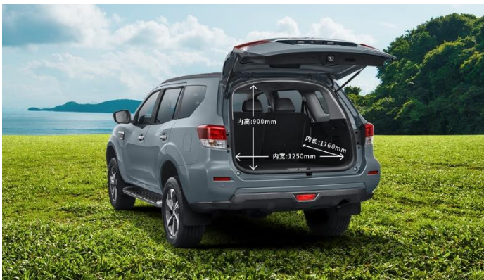
Багажное отделение вместимостью до 2520 литров