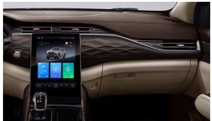
12,0" цветной дисплей мультимедиа на центральной консоли

Информация, представленная на данном листе, не является публичной офертой. Содержимое спецификации составлено на основе информации о состоянии конфигурации автомобиля на момент составления данного документа. Чтобы лучше удовлетворять потребности клиентов, производитель продолжает разработывать и совершенствовать автомобили. Некоторые конфигурации и характеристики моделей, продаваемых на рынке, могут отличаться от этой конфигурации. Для получения более подробной информации обращайтесь к авторизованным дилерам Dongfeng в Беларуси.