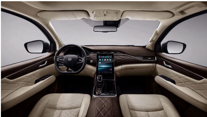
Бежевый с тёмно-коричневыми элементами