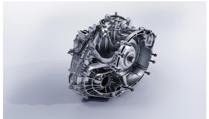
8-ступенчатая автоматическая коробка передач ZF