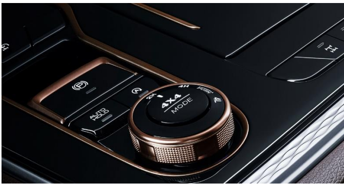
Система полного привода Off-Road Part-Time