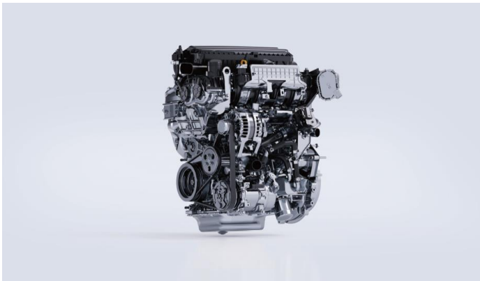
двигатель Mitsubishi 4K31TD 2.0 турбо (218 л.с.)