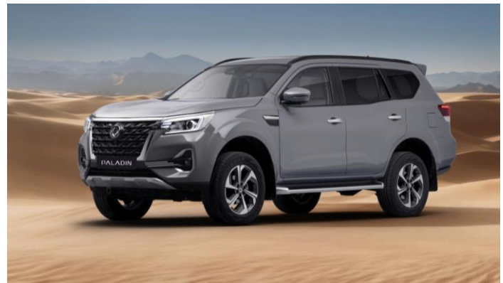
Блокировка переднего и заднего дифференциалов