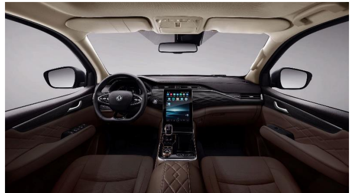
Чёрный с тёмно-коричневыми элементами

Информация, представленная на данном листе, не является публичной офертой. Содержимое спецификации составлено на основе информации о состоянии конфигурации автомобиля на момент составления данного документа. Чтобы лучше удовлетворять потребности клиентов, производитель продолжает разрабатывать и совершенствовать автомобили. Некоторые конфигурации и характеристики моделей, продаваемых на рынке, могут отличаться от этой конфигурации. Для получения более подробной информации обращайтесь к авторизованному дилерам Dongfeng в Беларуси.