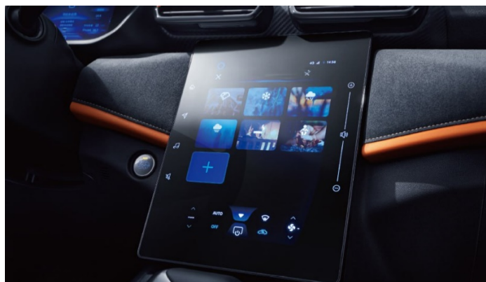
Мультимедийная система WindLink с экраном 13" ULTRA HD