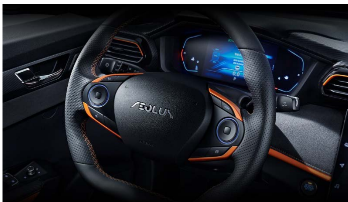
7" цифровая приборная панель водителя