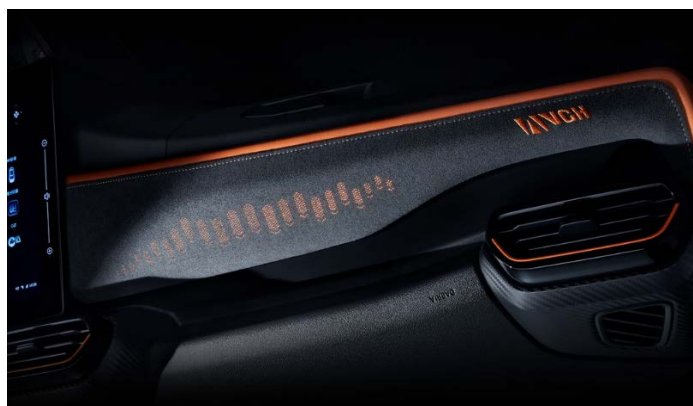
Отделка центральной консоли и боковых дверей замшей