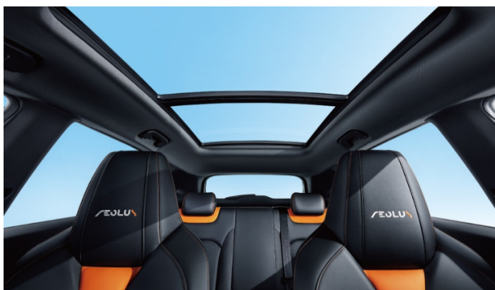
Панорамная крыша с площадью остекления 1,08 кв.м.