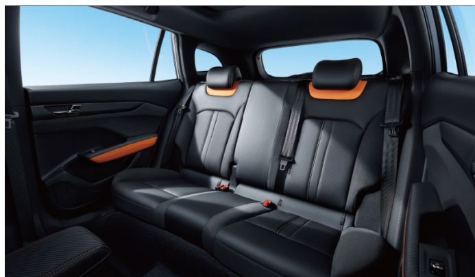
Пространство для коленей задних пассажиров – 285 мм

Информация, предоставленная на данном листе, не является публичной офертой. Содержимое спецификации составлено на основе информации о состоянии конфигурации автомобиля на момент составления данного документа. Чтобы лучше удовлетворять потребности клиентов, производитель продолжает разрабатывать и совершенствовать автомобили. Некоторые конфигурации и характеристики моделей, продаваемых на рынке, могут отличаться от этой конфигурации. Для получения более подробной информации обращайтесь к авторизованным дилерам Dongfeng в Беларуси.