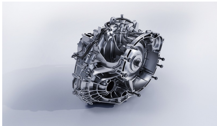
Автоматическая коробка передач DCT6 производства Getrag