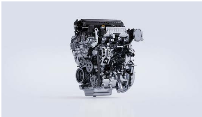
Моторы Mach Power, созданные с учетом опыта производства DFM-Honda