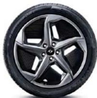
ЛЕГКОСПЛАВНЫЕ ДИСКИ 255/50 R18 «STAR WING»