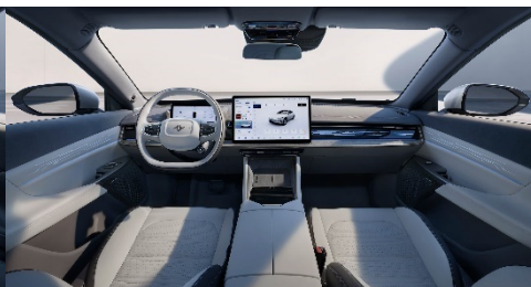
СВЕТЛО-СЕРЫЙ С ТЁМНЫМИ ЭЛЕМЕНТАМИ