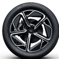
ЛЕГКОСПЛАВНЫЕ ДИСКИ 235/45 R19 «LOW DRAG»