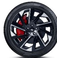
ЛЕГКОСПЛАВНЫЕ ДИСКИ 235/45 R19 «PERFORMANCE RIMS»