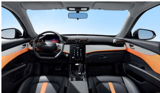
Черный со светло-серыми и оранжевыми акцентными элементами, светло-серый потолок