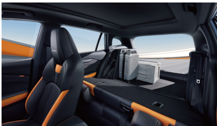
Багажник объемом 1 609 л – при сложенных сиденьях второго ряда