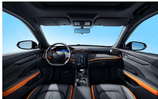
Черный Sport с темно-серыми и оранжевыми акцентными элементами, лого Mach, темно-серый потолок

Информация, предоставленная на данном листе, не является публичной офертой. Содержимое спецификации составлено на основе информации о состоянии конфигурации автомобиля на момент составления данного документа. Чтобы лучше удовлетворять потребности клиентов, производитель продолжает разрабатывать и совершенствовать автомобили. Некоторые конфигурации и характеристики моделей, продаваемых на рынке, могут отличаться от этой конфигурации. Для получения более подробной информации обращайтесь к авторизованным дилерам Dongfeng в Беларуси.