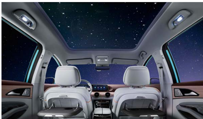
Панорамная крыша площадью 1,8 метра с солнцезащитной шторкой