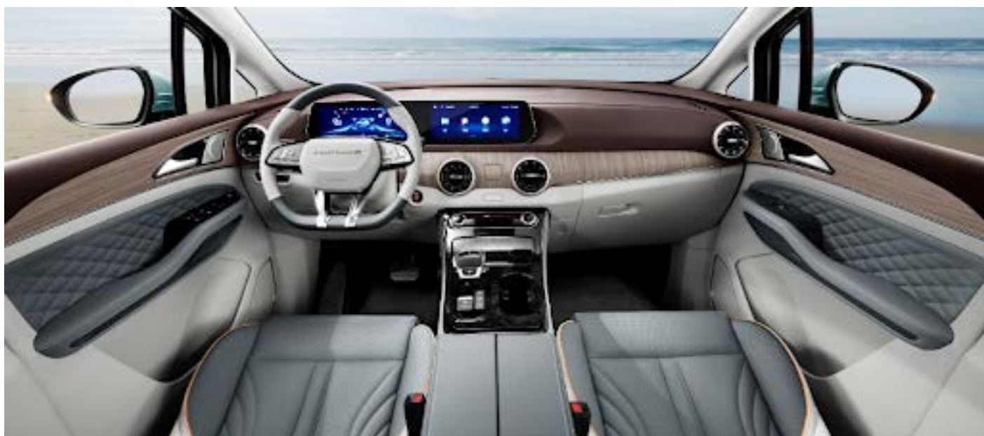
Тёмно-серый с бежевыми и коричневыми элементами

Информация, представленная на данном листе, не является публичной офертой. Содержимое спецификации составлено на основе информации о состоянии конфигурации автомобиля на момент составления данного документа. Чтобы лучше удовлетворять потребности клиентов, производитель продолжает разрабатывать и совершенствовать автомобили. Некоторые конфигурации и характеристики моделей, продаваемых на рынке, могут отличаться от этой конфигурации. Для получения более подробной информации обращайтесь к авторизованным дилерам Dongfeng в Беларуси.