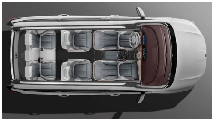
Полноразмерные 7 мест с возможностью трансформации