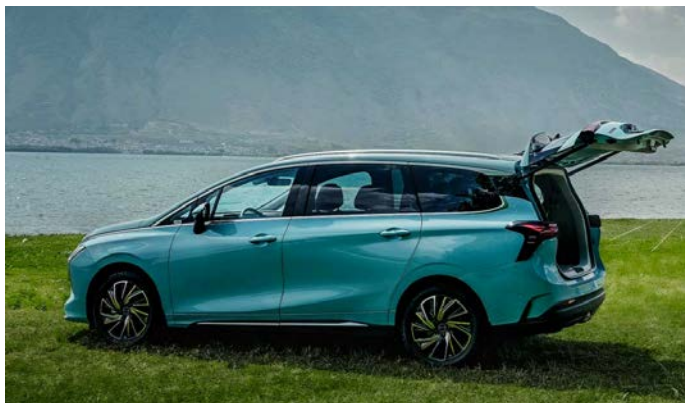
Электрпривод багажника с бесконтактным открыванием