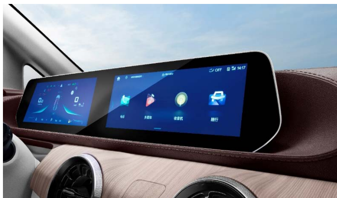
HD дисплей, состоящий из 2-х экранов с общей диагональю 20,5"