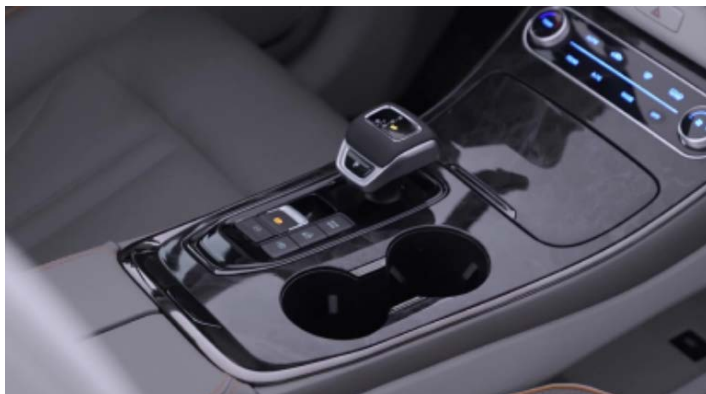
АКП с двойным «мокрым» сцеплением DCT7 производства Getrag