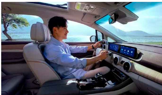
Массаж и память сиденья водителя