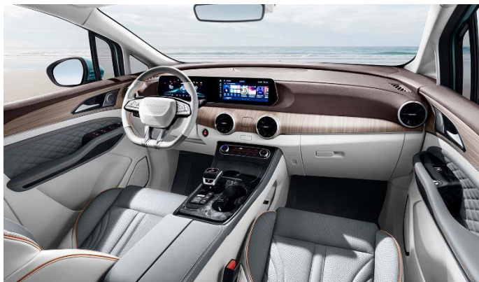
Электрорегулировка передних сидений