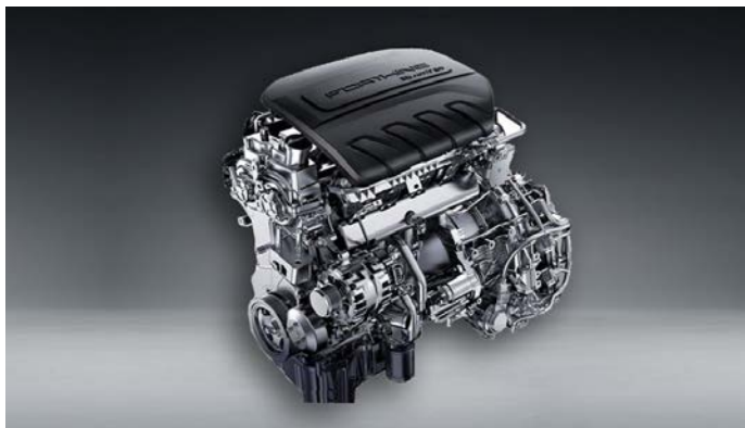
Турбированный двигатель Mitsubishi 4A95TD мощностью 197 л.с.