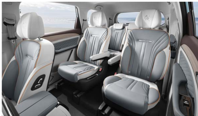
Обогрев и вентиляция сидений 1-го и 2-го рядов