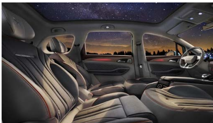
10 вариантов трансформации салона с получением ровного пола