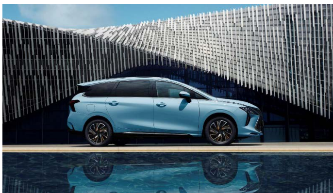
Длина - 4 850 мм / колёсная база – 2 900 мм