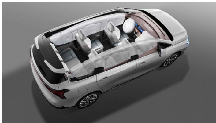
10 подушек безопасности (5 звёзд C-NCAP)