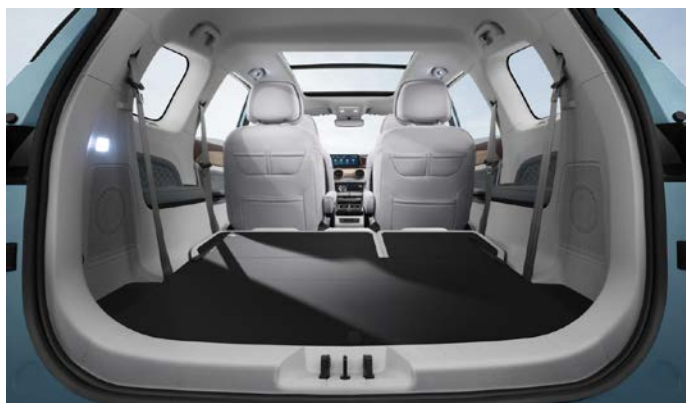
Багажное отделение вместимостью до 2 370 литров

Информация, представленная на данном листе, не является публичной офертой. Содержимое спецификации составлено на основе информации о состоянии конфигурации автомобиля на момент составления данного документа. Чтобы лучше удовлетворять потребности клиентов, производитель продолжает разрабатывать и совершенствовать автомобили. Некоторые конфигурации и характеристики моделей, продаваемых на рынке, могут отличаться от этой конфигурации. Для получения более подробной информации обращайтесь к авторизованным дилерам Dongfeng в Беларуси.