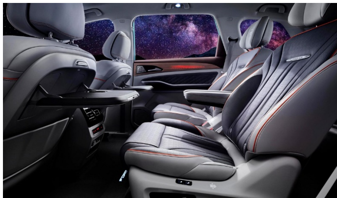
Капитанские сиденья 2-го ряда с электрорегулировкой и столиками