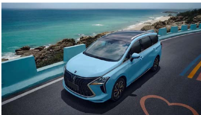
Матричные LED фары с функцией автоматического переключения

Информация, представленная на данном листе, не является публичной офертой. Содержимое спецификации составлено на основе информации о состоянии конфигурации автомобиля на момент составления данного документа. Чтобы лучше удовлетворять потребности клиентов, производитель продолжает разрабатывать и совершенствовать автомобили. Некоторые конфигурации и характеристики моделей, продаваемых на рынке, могут отличаться от этой конфигурации. Для получения более подробной информации обращайтесь к авторизованным дилерам Dongfeng в Беларуси.